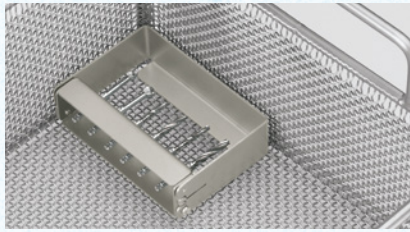
Abb. 1 Platzierung des Instrumentenständers in das RDG.